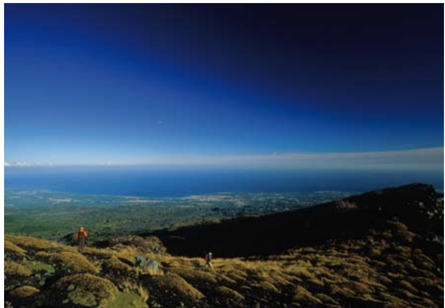
◉ Serra delle Concazze. Al fons, la costa oriental de Sicília.

Per als amants de la natura que prefereixin les excursions de més d'un dia, l'opció perfecta és l'anell que rodeja el volcà. Es tracta d'una travessa que és factible realitzar-la en quatre jornades i que sempre es mou entre els 1.500 i els 2.000 m d'altitud. Abans de començar la marxa, però, allò ideal és fer un petit recorregut als voltants de l'estació turística del refugi