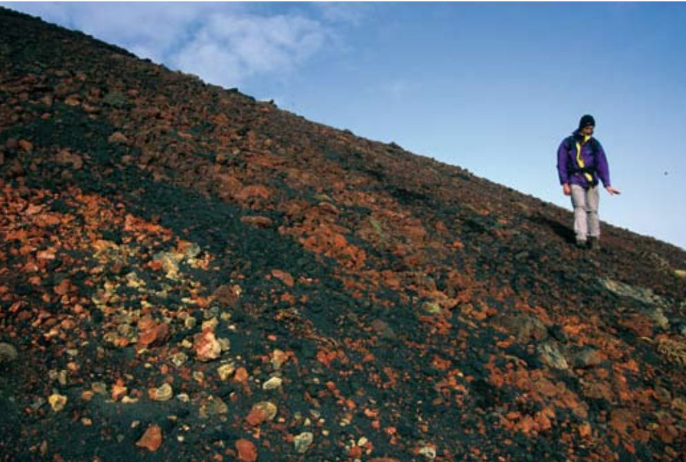
◉ La falta de camins i el terreny canviant dificulta les caminades en alguns sectors del massís.