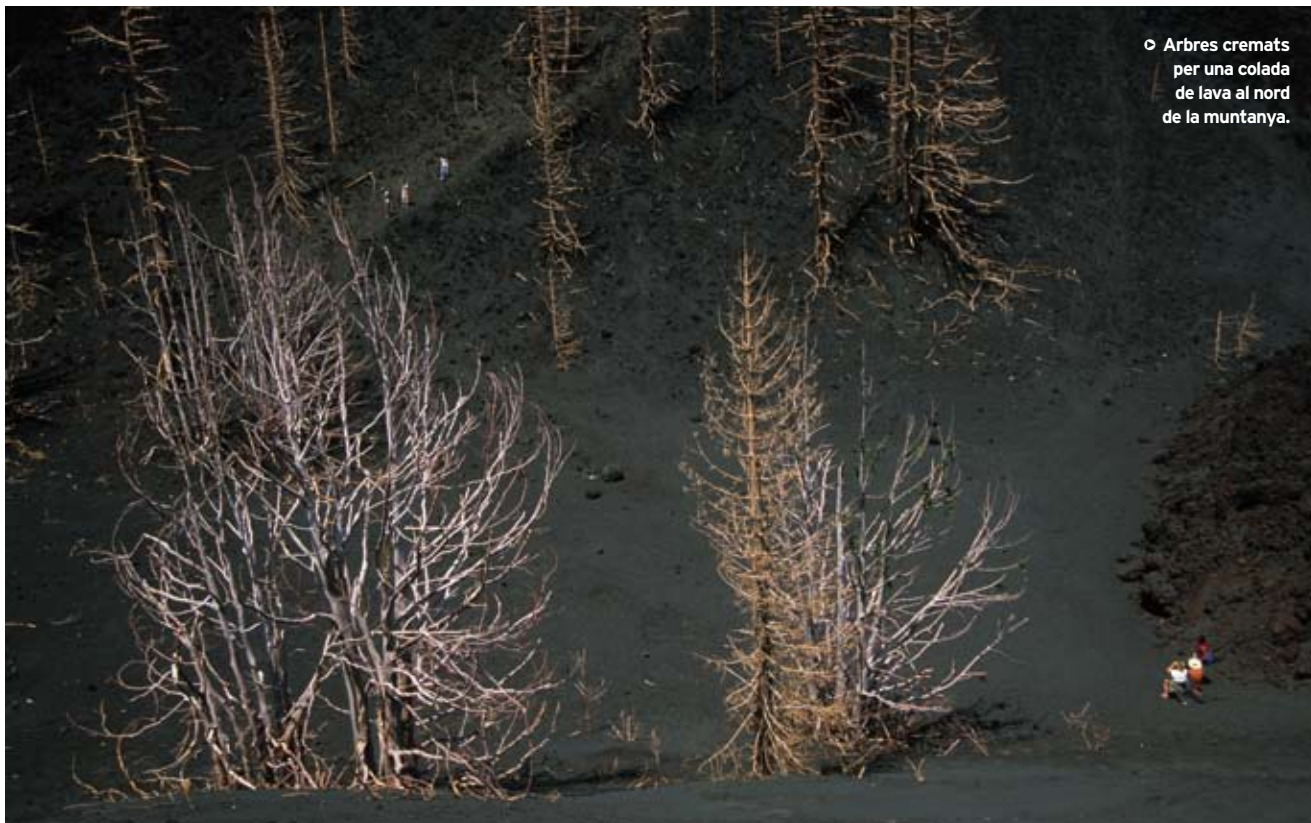
◉ Arbres cremats per una colada de lava al nord de la muntanya.