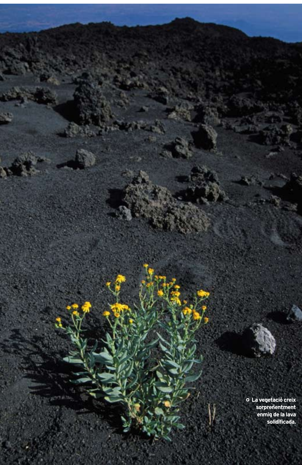
◉ La vegetació creix sorprenentment enmig de la lava solidificada.

que es pot visitar. Continuem pel camí que ara s'enfila clarament vers la cresta, on arribem en poc més de mitja hora. Contemplem l'espectacular vall del Bove i el cim de l'Etna, sempre fumejant. Es pot continuar per l'aresta cap a la dreta, en direcció nord-oest fins al Pizzo dei Deneri, però cal preveure-hi tot un dia perquè no hi ha sender marcat. El descens segueix l'itinerari de pujada. V