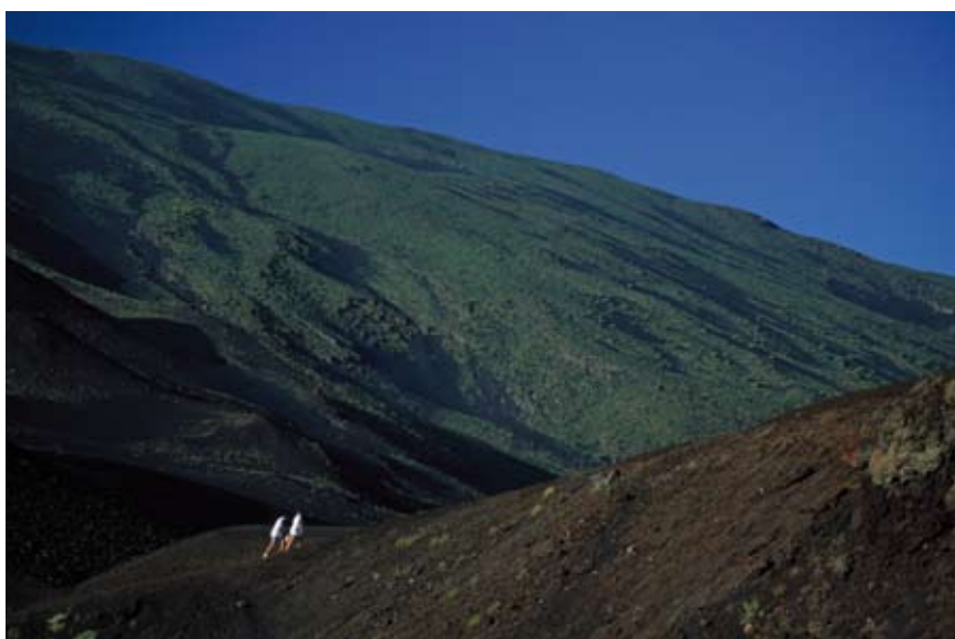
◉ Jocs de colors a prop del refugi Sapienza.

la carretera (1.670 m) i se segueix vers la dreta fins al refugi Citelli (1.741 m).