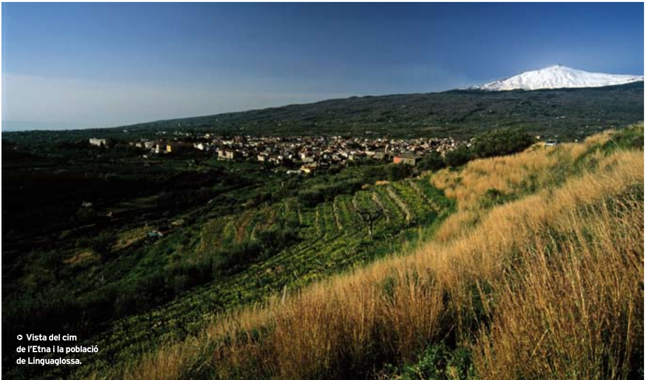
◉ Vista del cim de l'Etna i la població de Linguaglossa.

L'omnipresència de l'Etna sobre Sicília s'explica perquè en una illa on les màximes altures tot just superen els dos quilòmetres, de sobte hi apareix una geganta de 3.343 m visible en els dies clars des de grans llunyanies. Aquest enorme volcà elevat sobre la costa est siciliana espanta, però alhora protegeix la població de l'illa. Les seves terres són increïblement fèrtils i la vida hi brolla espontàniament. La lava solidificada és negra, com ho demostren els carrers i edificis de les poblacions construïdes al peu de l'Etna; però el panorama, contràriament al que hom podria pensar, és inusualment verd; d'un verd exuberant, únic en tota l'illa. L'abundància de minerals del terreny permet que la vegetació creixi amb força fins als 1.500 metres i dona lloc a una riquesa de paisatges que van portar la zona, l'any 1987, a ser declarada parc natural. Un parc que té com a amenaça principal l'humor canviant de la seva protagonista perquè l'Etna és un volcà actiu, i en certs períodes molt actiu! L'estiu del 2001 es va despertar bastant enfadat i va provocar l'ensurt dels pobles arraulits sota la seva ombra. Des d'aquell moment, el cràter principal només es pot visitar si s'hi va acompanyat dels guies locals. Aquest fet, però, no limita ni molt menys les possibilitats excursionistes del massís.