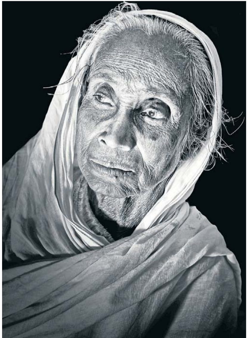
BLANC DE DOL. Mirades de joia, de súplica, d'aprensíó o senzillament d'absència... Les viudes a l'Índia no tenen una vida fàcil i moltes viuen dedicades a l'oració i devoció al déu Krixna. Es reconeixen pels dibuixos que sovint porten al front i pels vestits blancs que les identifiquen davant una societat que encara no accepta la seva presència i que les converteix en persones invisibles sense drets ni possibilitats de sobreviure per elles mateixes.